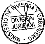
CARLOS MONTES CISTERNAS MINISTRO DE VIVIENDA Y URBANISMO

[Handwritten signature of Carlos Montes Cisternas]