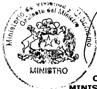
CARLOS MONTES CISTERNAS MINISTRO DE VIVIENDA Y URBANISMO