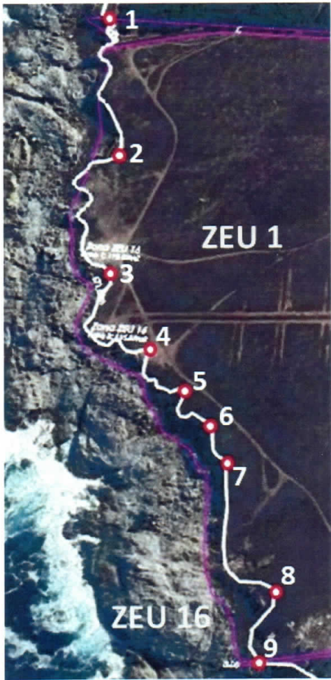
Imagen 4: Interpretación de la delimitación de zonas ZEU 1 y ZEU 16 del PREMVAL en el predio