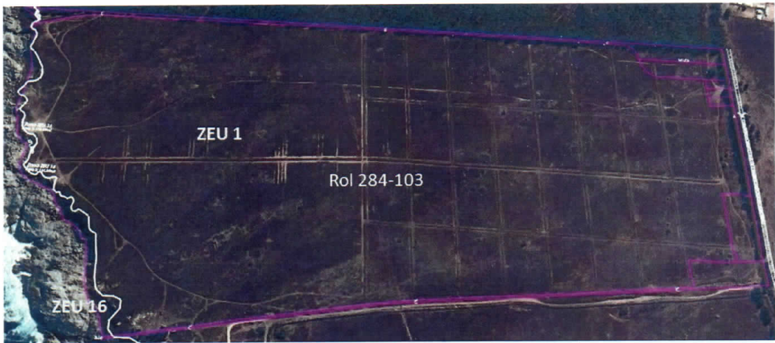
Imagen 3: Terreno completo con distinción de los dos encuentros de zonas del PREMVAL

Analizada la delimitación de las zonas del PREMVAL sobre el predio identificado con el Rol de Avalúo N° 284-103 de la comuna de Quintero, informado en los antecedentes, consta que éste se encuentra normado por las zonas ZEU 1 y ZEU 16, según se indica en la imagen 3, a continuación, respecto de lo que cabe destacar que específicamente la Zona ZEU 16 tiene como propósito resguardar con norma más restrictiva el sector que abarca desde la línea de más alta marea hasta la cima de los acantilados costeros. En consecuencia, por la vía interpretativa según el artículo 4 de la LGUC, hemos detallado el trazado que delimita la Zona ZEU-16 de la Zona ZEU-1 respecto del Lote Rol 284-103, respetando el borde de los acantilados.